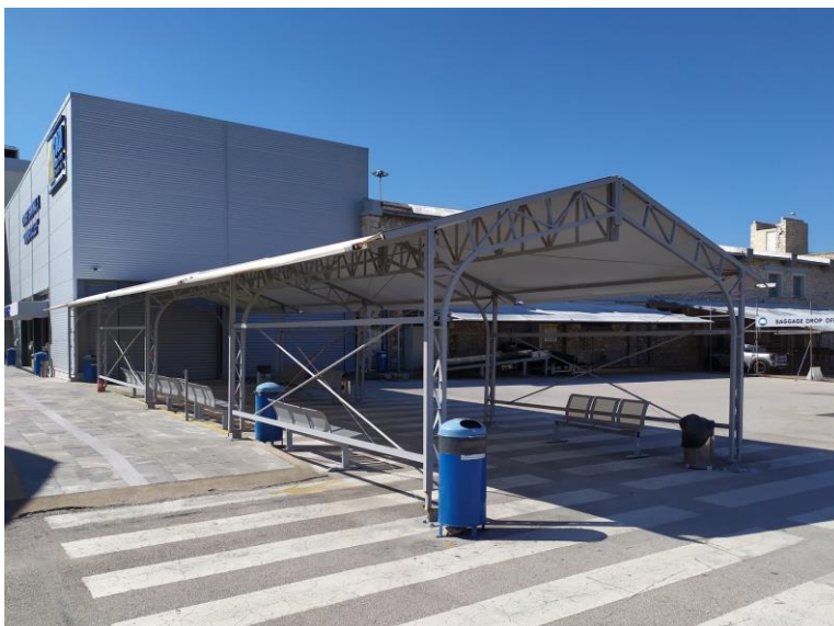
Εικόνες 2,3 & 4: Υφιστάμενο σύστημα σκίασης για την εξυπηρέτηση των επιβατών στην περιοχή του Επιβατικού Σταθμού «Θεμιστοκλής». Το νέο σύστημα θα κατασκευαστεί ως επέκταση αυτού